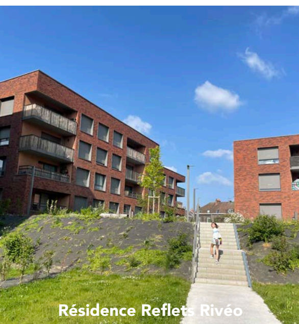
Résidence Reflets Rivéo