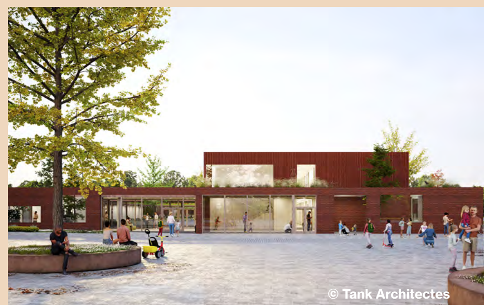
Le futur groupe scolaire Jacques Chirac, place de La Bourgogne.