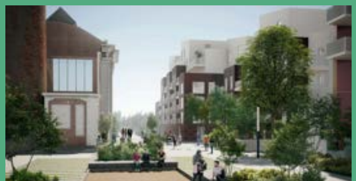
VILLE RENOUVELÉE - Cours des peignages (livraison 2024)