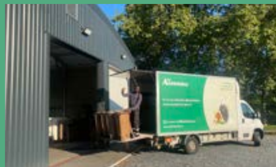
LES ALCHEMISTES Centre de micro compostage industriel (livré à l'été 2023)