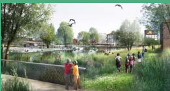
VILLE RENOUVELÉE - Parc bassin fréquenté (livraison 2024)