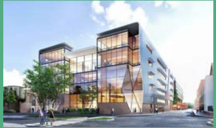
ARTFX ET OPALIA - Campus ARTFX (effets spéciaux) : école, studios de tournage, résidence étudiante, incubateur (livré à l'été 2023)