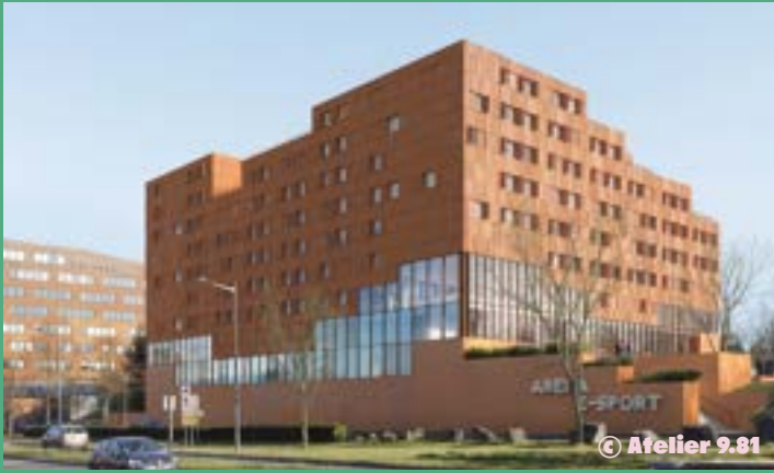
IDÉEL - Campus sport : arena, centre de formation, espace jeux vidéo, résidence étudiante (livraison 2025)