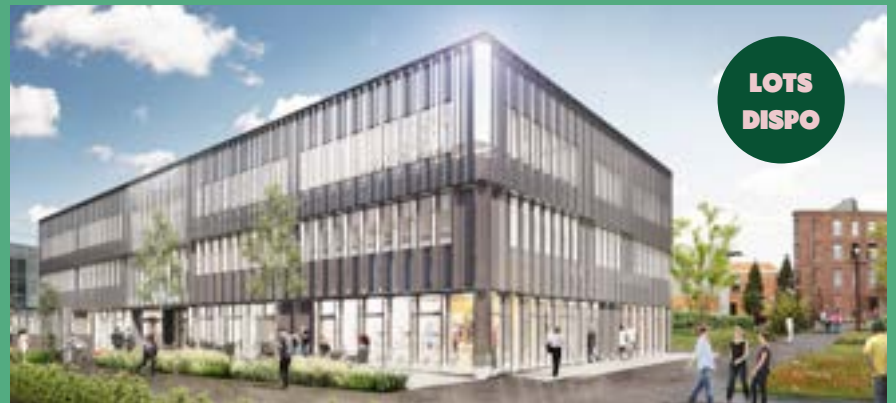
VILLE RENOUVELÉE - Programme de bureaux «Smart» (livré à l'été 2023)