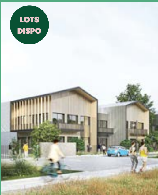
SPIRIT - Campus d'entreprises : 9 000m 2 d'ateliers et bureaux pour TPE/PME (livraison 2025)