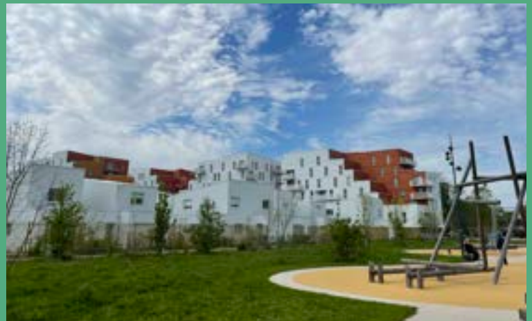
ICADE PROMOTION - Programme de 223 logements «Cime et Parc» (livraison en cours)