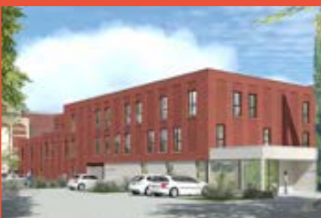
MATIM ET AFEJI – Foyer pour jeunes femmes (livraison 2025)

En 2022, nous comptons près de 740 logements en construction ou en développement sur ce territoire en mouvement.