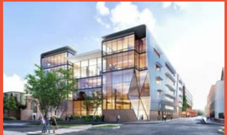
ARTFX ET OPALIA – Campus ARTFX (effets spéciaux) : école, studios de tournage, résidence étudiante, incubateur (livré à l'été 2023)