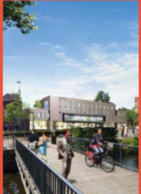
NAME IMMOBILIER Programme mixte commerces / co-living / hôtel (livraison 2023, hors hôtel)