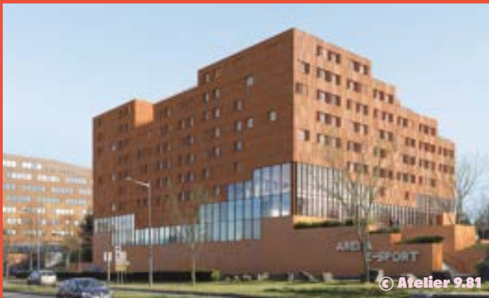
IDÉEL – Campus sport : arena, centre de formation, espace jeux vidéo, résidence étudiante (livraison 2025)