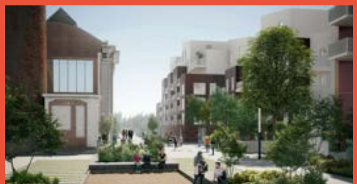
VILLE RENOUVELÉE – Cours des peignages (livraison 2024)