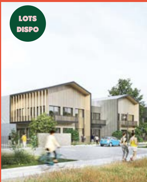
SPIRIT – Campus d'entreprises : 9 000m 2 d'ateliers et bureaux pour TPE/PME (livraison 2025)