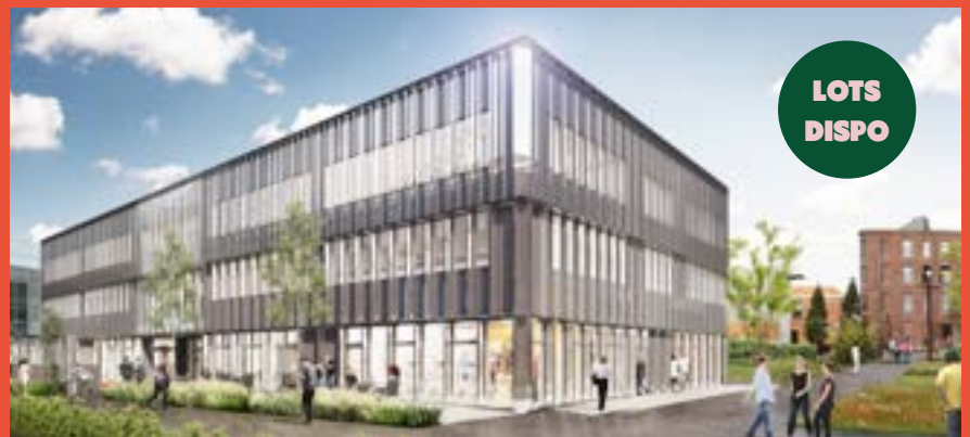
VILLE RENOUVELÉE – Programme de bureaux «Smart» (livré à l'été 2023)