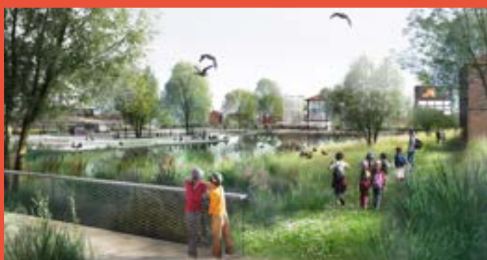
VILLE RENOUVELÉE – Parc bassin fréquenté (livraison 2024)