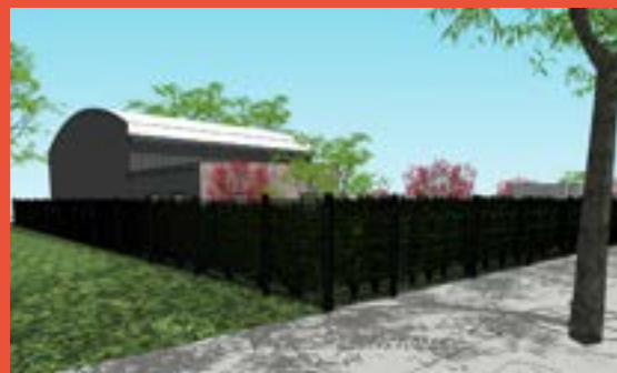
LES ALCHIMISTES Centre de micro compostage industriel (livré à l'été 2023)