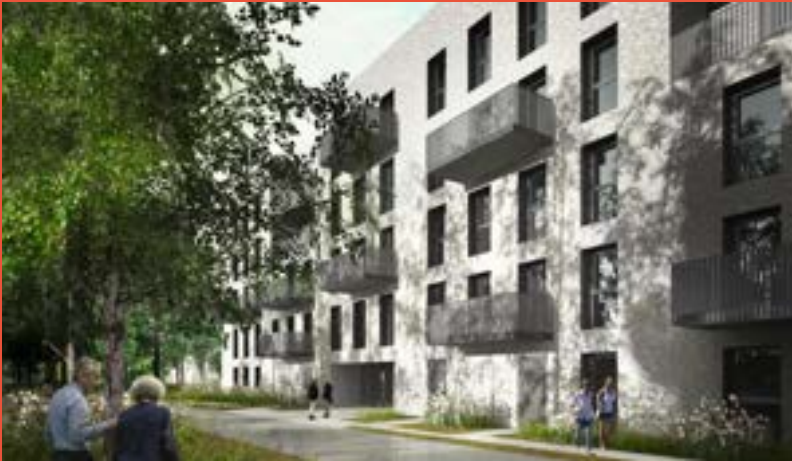
PROMOGIM – programme de 70 logements «Villa Factory» (livraison fin 2023)