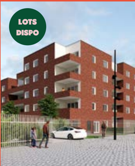
CARRERE – Programme de 141 logements «Nouvel'Aire» (livraison 2025)