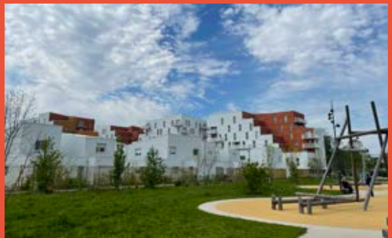
ICADE PROMOTION – Programme de 223 logements «Cime et Parc» (livraison en cours)