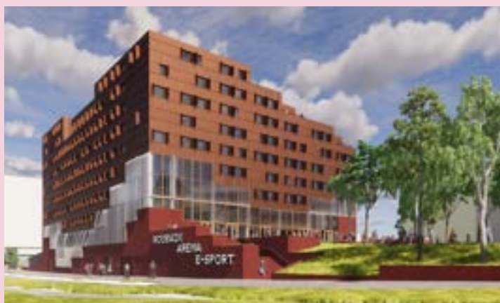
IDÉEL – Campus sport : arena, centre de formation, espace jeux vidéo, résidence étudiante (livraison 2025)