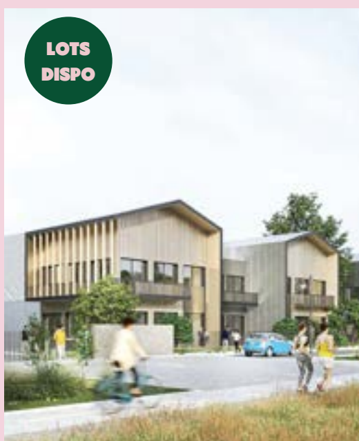
SPIRIT – Campus d'entreprises : 9 000m 2 d'ateliers et bureaux pour TPE/PME (livraison 2025)