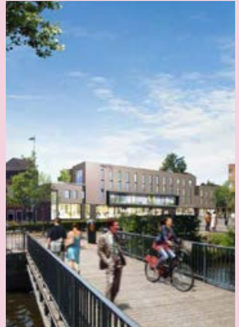
NAME IMMOBILIER Programme mixte commerces / co-living / hôtel (livraison 2023, hors hôtel)