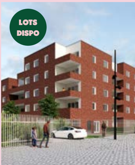
CARRERE - Programme de 141 logements «Nouvel'Aire» (livraison 2025)