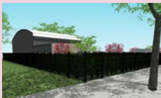
LES ALCHEMISTES Centre de micro compostage industriel (livraison 2023)