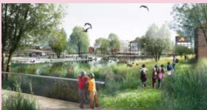
VILLE RENOUVELÉE – Parc bassin fréquenté (livraison 2024)