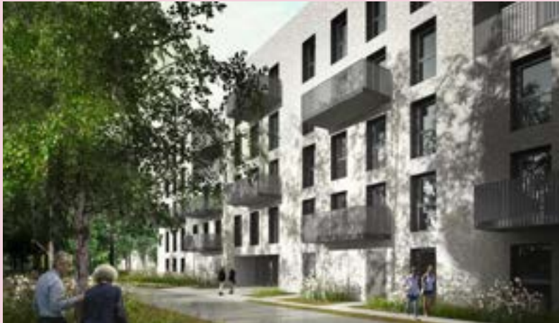
PROMOGIM - programme de 70 logements «Villa Factory» (livraison fin 2023)