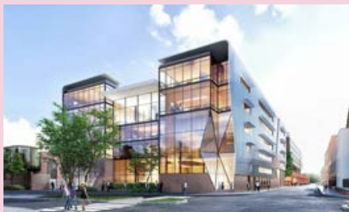
ARTFX ET OPALIA – Campus ARTFX (effets spéciaux) : école, studios de tournage, résidence étudiante, incubateur (livraison été 2023)