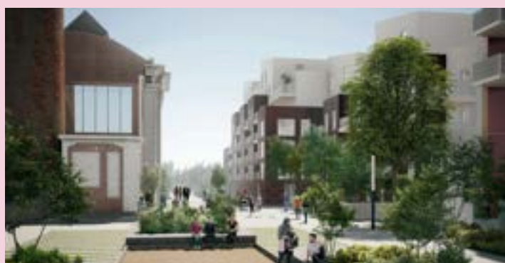
VILLE RENOUVELÉE – Cours des peignages (livraison 2024)