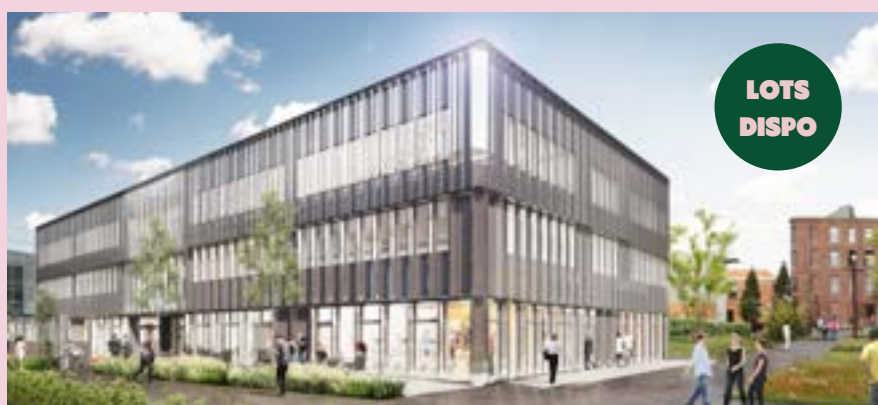
VILLE RENOUVELÉE – Programme de bureaux «Smart» (livraison en cours)