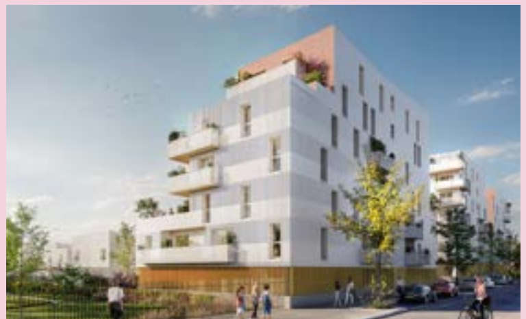
ICADE PROMOTION ET NOTRE LOGIS - Programme de 223 logements «Cime et Parc» (livraison en cours)