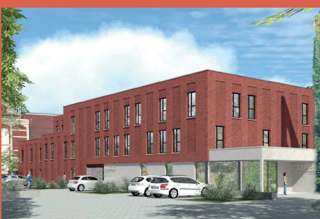
MATIM ET AFEJI – Foyer pour jeunes femmes (livraison 2025)

En 2022, nous comptons près de 740 logements en construction ou en développement sur ce territoire en mouvement.