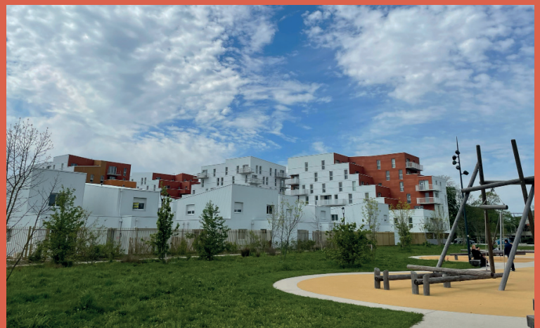
ICADE PROMOTION – Programme de 223 logements «Cime et Parc» (livraison en cours)