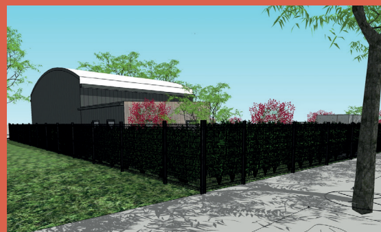
LES ALCHEMISTES Centre de micro compostage industriel (livré à l'été 2023)