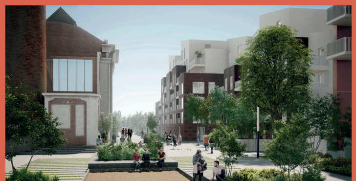
VILLE RENOUVELÉE – Cours des peignages (livraison 2024)