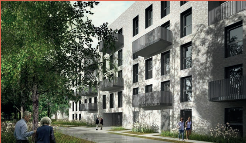
PROMOGIM – programme de 70 logements «Villa Factory» (livraison fin 2023)