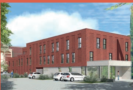
MATIM ET AFEJI – Foyer pour jeunes femmes (livraison 2025)

En 2022, nous comptons près de 740 logements en construction ou en développement sur ce territoire en mouvement.