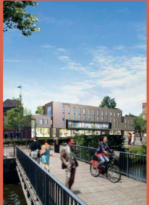
NAME IMMOBILIER Programme mixte commerces / co-living / hôtel (livraison 2023, hors hôtel)