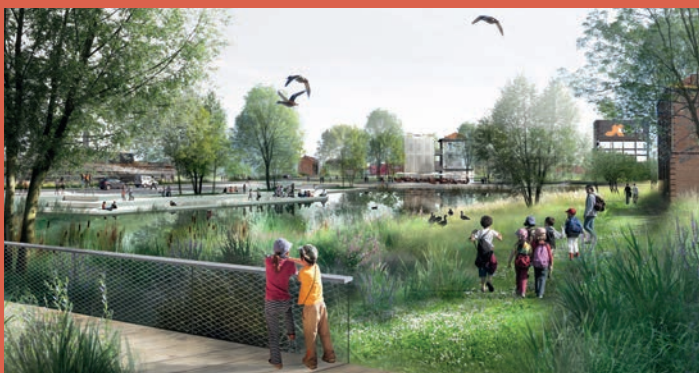
VILLE RENOUVELÉE – Parc bassin fréquenté (livraison 2024)