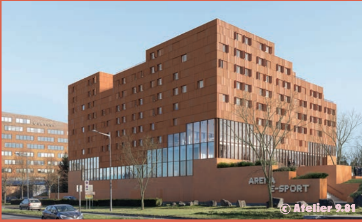
IDÉEL – Campus sport : arena, centre de formation, espace jeux vidéo, résidence étudiante (livraison 2025)