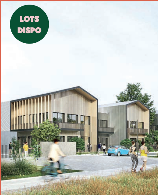
SPIRIT – Campus d'entreprises : 9 000m 2 d'ateliers et bureaux pour TPE/PME (livraison 2025)