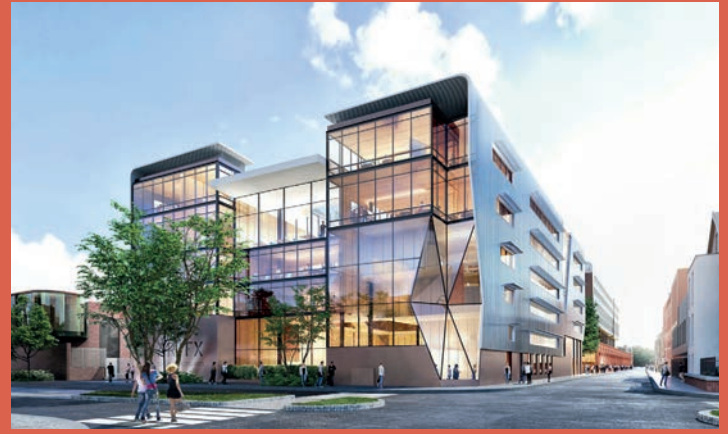
ARTFX ET OPALIA – Campus ARTFX (effets spéciaux) : école, studios de tournage, résidence étudiante, incubateur (livré à l'été 2023)