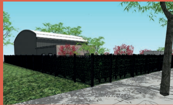
LES ALCHEMISTES Centre de micro compostage industriel (livré à l'été 2023)