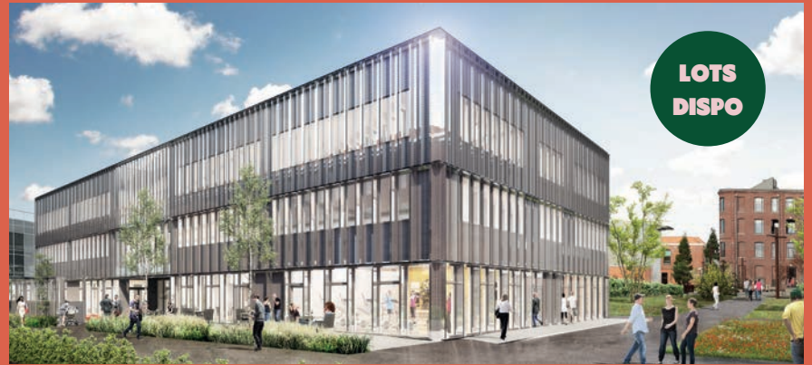
VILLE RENOUVELÉE – Programme de bureaux «Smart» (livré à l'été 2023)