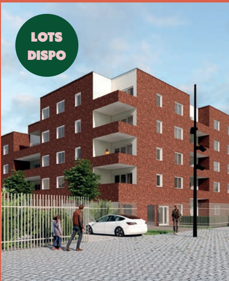
CARRERE – Programme de 141 logements «Nouvel'Aire» (livraison 2025)